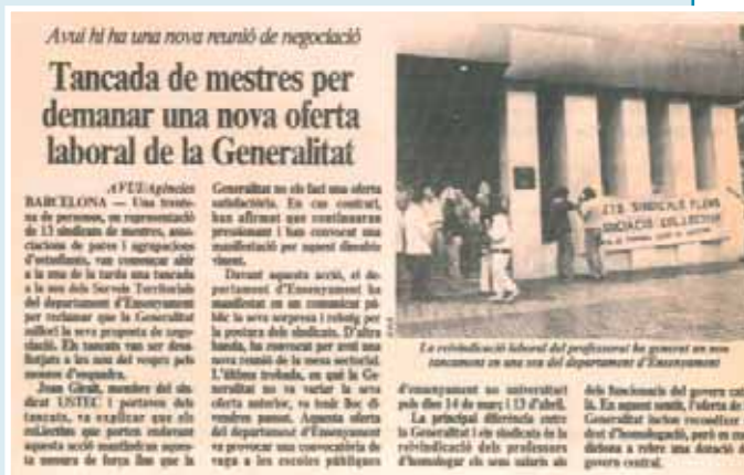
AVUI, 9 de març de 1989