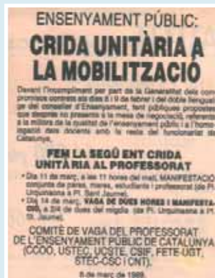
AVUI, 9 de març de 1989