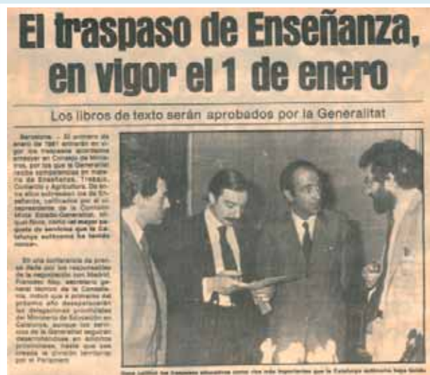
EL PERIODICO, 5 d'octubre de 1980

Era el meu últim curs al CN Font dels Eucaliptus, de Torre Baró -Nou Barris-, a la perifèria de Barcelona. Les classes van començar a finals de setembre. Després de les eleccions municipals, els ajuntaments democràtics exigien més mestres per als seus municipis i fins que "Madrid" (el MEC) no en va destinar 2.000 més a Catalunya, no es va començar el curs. Van ser moments d'eufòria i unitat entre les famílies, els mestres i els nous ajuntaments, amb manifestacions a tots els pobles. A Barcelona ens manifestàvem davant de la Delegación del Ministerio de Educación y Ciencia ara a Plaça Espanya (un lloc molt apropiat, oi?) i també a la Plaça Catalunya.