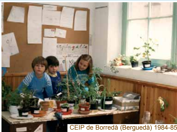
CEIP de Borredà (Berguedà) 1984-85

Al setembre del 83 es va experimentar un nou model de formació del professorat, el FOPI, al Berguedà. Era una zona rural amb 10 escoles petites, d'un o dos mestres que estàvem totalment desvinculats. Aquest FOPI ens va donar la possibilitat, per primer cop, de formar-nos i coordinar-nos, de repensar el nostre treball diari i de crear materials adaptats a les nostres necessitats.