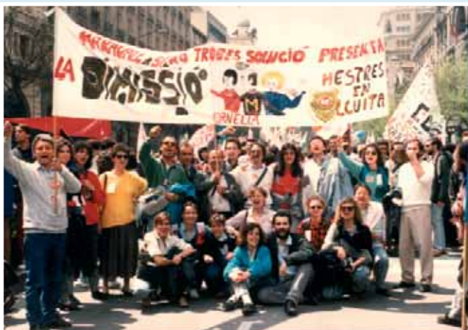
Manifestació a Madrid, 27 d'abril 1988