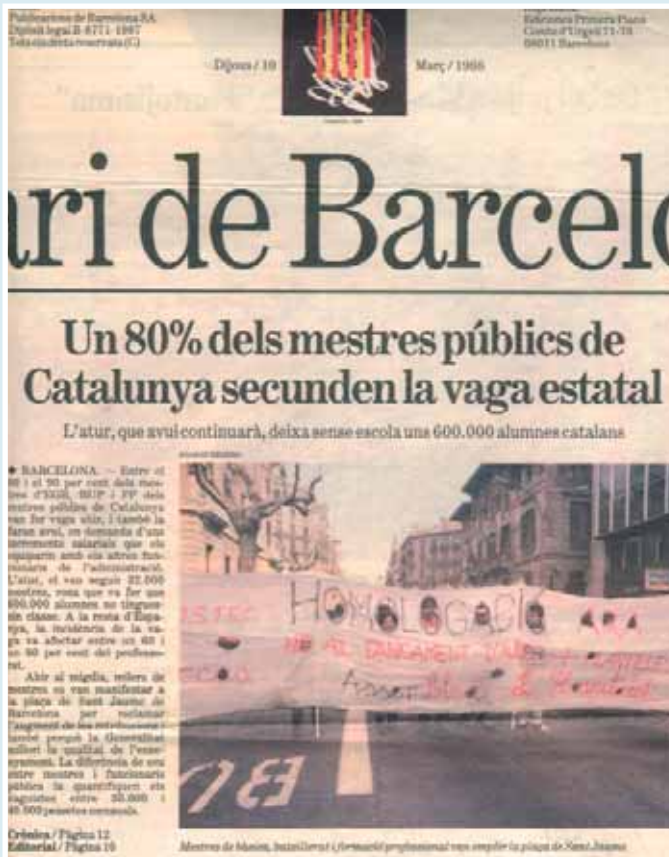
DIARI de BARCELONA, 10 de març de 1988