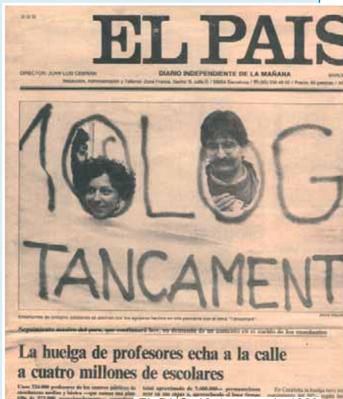
EL PAIS, 10 de març de 1988

El principal escull es va trobar en la posició tancada del govern central i les desqualificacions a les nostres demandes fetes pel ministre d'educació, Sr. Maravall. Es veia venir que seria un conflicte llarg i per primera vegada l'Administració va dir que descomptaria del salari els dies de vaga. Fins aquell moment, com que el dret de vaga no estava reconegut per al personal de les administracions públiques (ni el dret a la negociació col·lectiva), no ho havien fet mai.